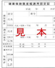
減額認定証(医療・介護)